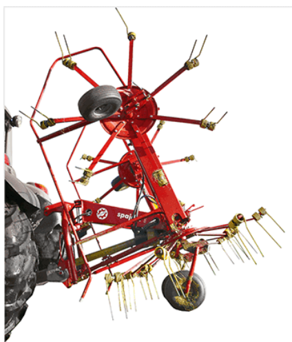
Pozycja transportowa – skrajne wirniki do pozycji transportowej składane są za pomocą silowników hydraulicznych.