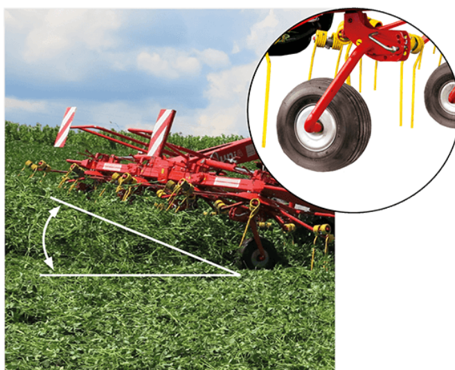
Regulowany kąt rozrzutu w czterech pozycjach w przedziale od 12 do 17 stopni.

Maszyna jest podłączona z ciągnikiem za pomocą trzypunktowego systemu mocowania. Na ramie głównej umocowane są ramiona boczne wraz z siłownikami odpowiedzialnymi za ustawienie przetrząsacza w położenie transportowe. Zespołami roboczymi przetrząsacza są palce sprężyste osadzone na ramionach grabiących. Koła podporowe umieszczone pod przekładniami ramion grabiących umożliwiają płynne pokonanie nierówności terenu.