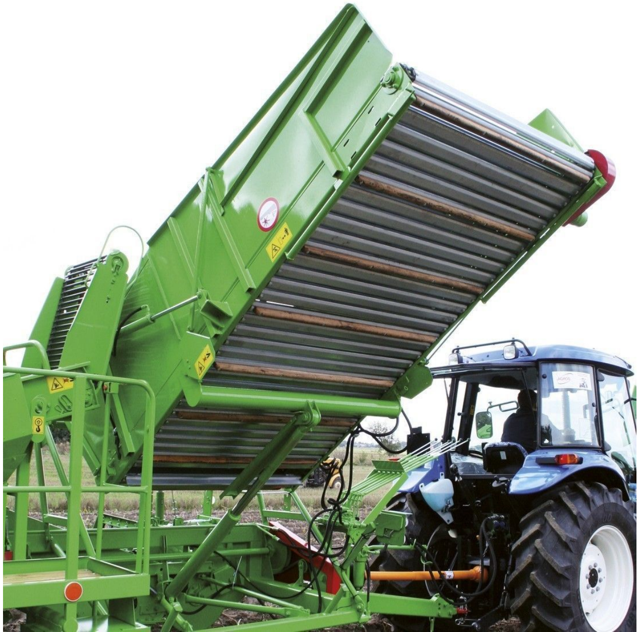
PYRA 1600 z podestem i workownicą