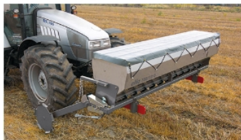
ALFA 750/12/3 zamontowana na przedni TUZ.

Możliwy wybór o różnej liczbie rozpraszaczy umożliwia szeroki zakres zastosowań