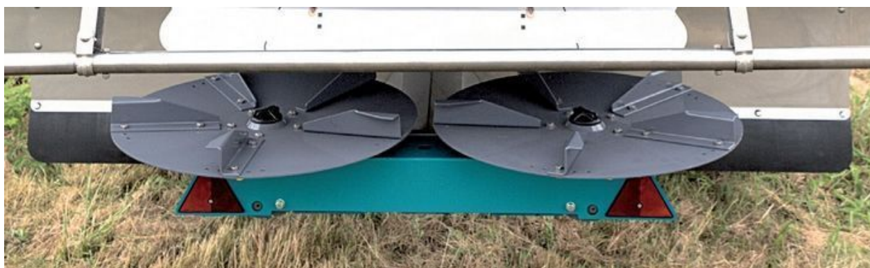
Fotografia powyżej: tarcze zamontowane na rozsiewaczu

Tarcze do wapna sypkiego, do materiałów wilgotnych