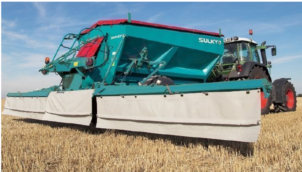
Foto: Rozsiewacz przyczepiany Sulky POLYVRAC XT 160 z belką do środków pylistych (np. do wapna pylistego) szerokość pracy 12 m.