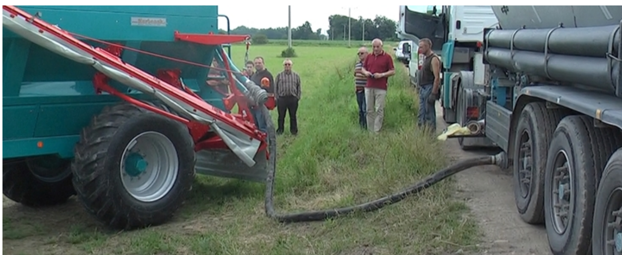
Załadunek wapna pylistego z cysterny

Możliwe jest również wygodne załadowanie rozsiewacza wapnem pylistym lub środkami pylistymi bezpośrednio z silosów.