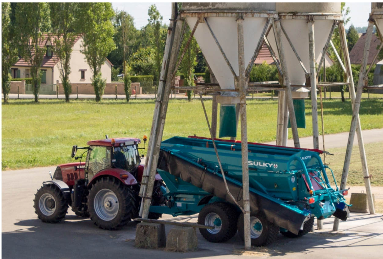
Wygodny załadunek z silosów

Możliwe jest również wygodne załadowanie rozsiewacza wapnem pylistym lub środkami pylistymi bezpośrednio z silosów.