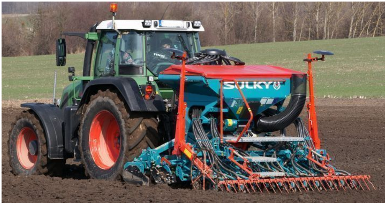
XEOS MD 3,0 m na bronie wirnikowej

Siewnik zbożowy pneumatyczny Sulky XEOS MD 3,0 m z redlicami talerzowymi, nabudowany na bronie wirnikowej: dzięki temu uzyskuje się ekonomiczny zestaw uprawowo-siewny. Siewnik posiada mechaniczny napęd dozownika, przenoszony z koła ostrogowego oraz turbinę z napędem mechanicznym, przenoszonym za pomocą wałka przegubowo-teleskopowego z WOM ciągnika.