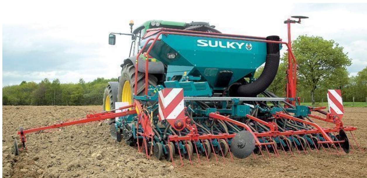
XEOS HD 4,0 m w zestawie z broną wirnikową

Siewnik zbożowy pneumatyczny Sulky XEOS MD 3,0 m z redlicami talerzowymi, nabudowany na bronie wirnikowej: dzięki temu uzyskuje się ekonomiczny zestaw uprawowo-siewny. Siewnik posiada mechaniczny napęd dozownika, przenoszony z koła ostrogowego oraz turbinę z napędem mechanicznym, przenoszonym za pomocą wałka przegubowo-teleskopowego z WOM ciągnika.