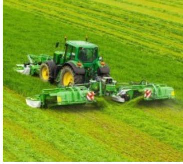
GigaCUT (860-940 CM)