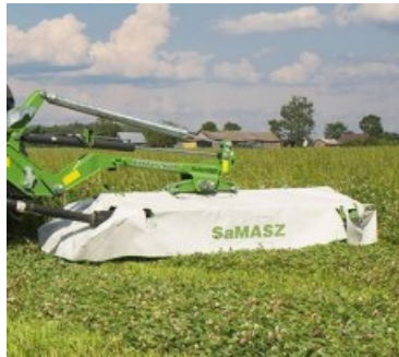
KDTC (260-340 CM)