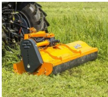
PIKO (100-150 CM)