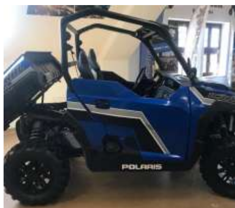
General 1000 Turbo