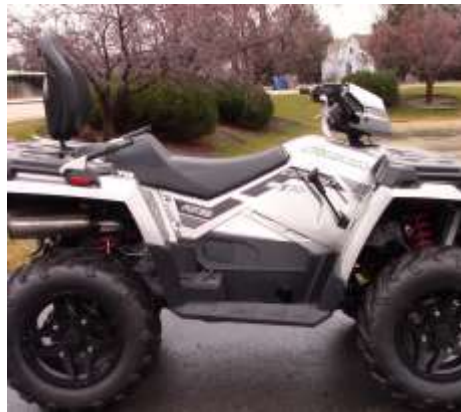
Sportsman 570 Touring_SP