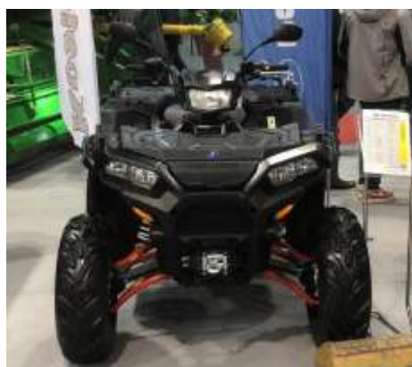
Sportsman XP 1000 Black