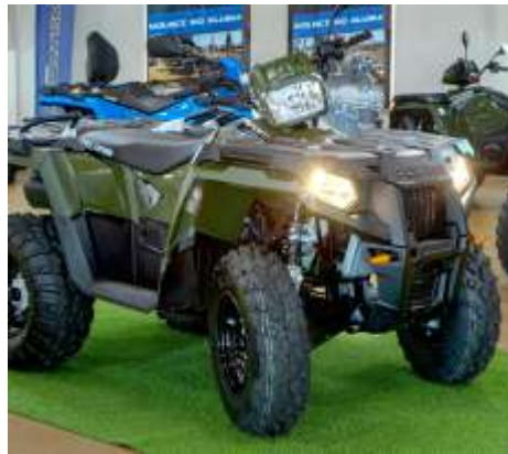
Sportsman 570 EPS