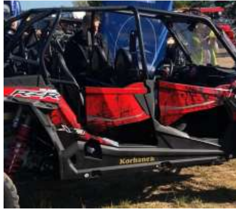
RZR XP 4 1000