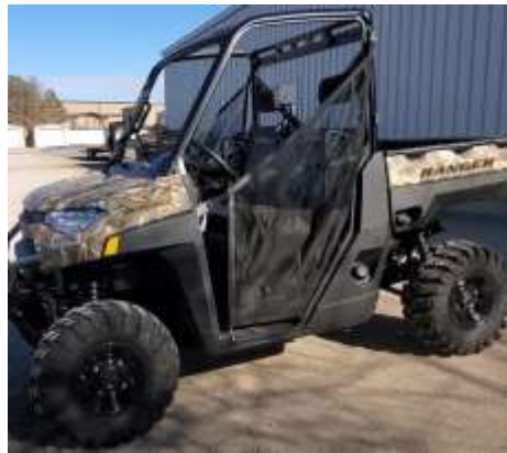
RANGER XP 1000 EPS CAMO