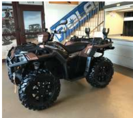
Sportsman XP 1000 LE FALCON