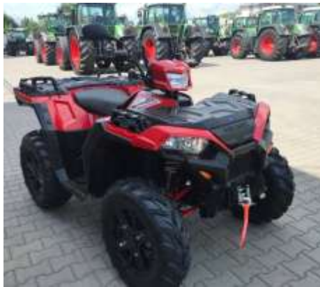
Sportsman XP 1000