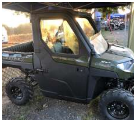
RANGER XP 1000 EPS