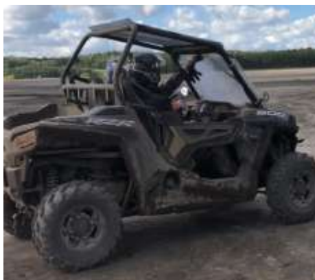
RZR 900 EPS