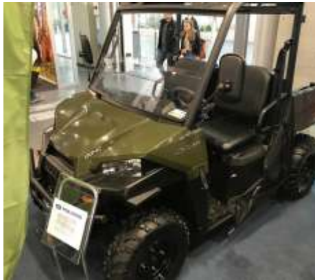
RANGER 570 EPS