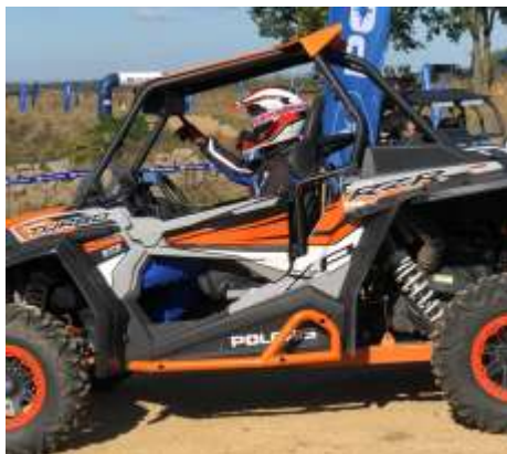
RZR XP TURBO EPS