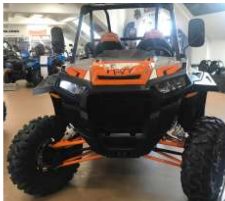
RZR TURBO X