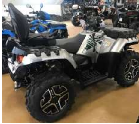
Sportsman Touring XP 1000