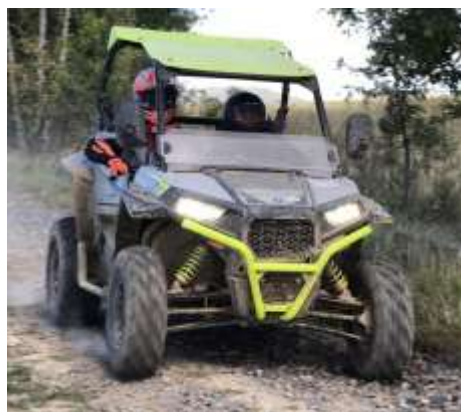
RZR 900 S EPS