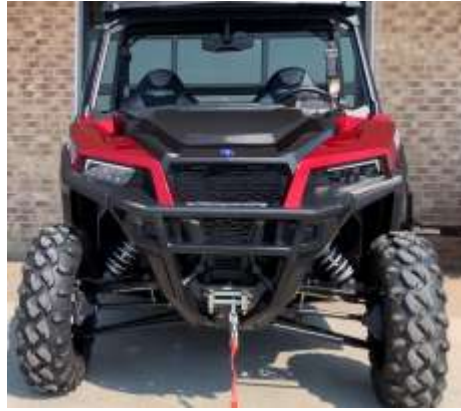
General XP 1000 EPS PREMIUM