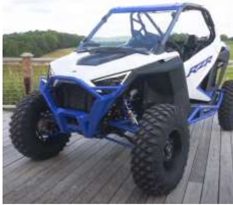
RZR PRO XP TURBO DYNAMIX