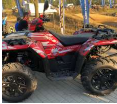
Sportsman XP 1000 HUSAR