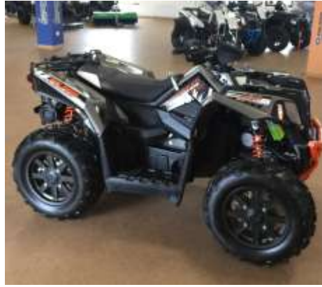
SCRAMBLER XP 1000 limited