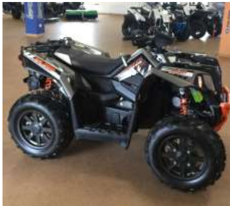
SCRAMBLER XP 1000 limited