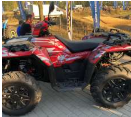
Sportsman XP 1000 HUSAR