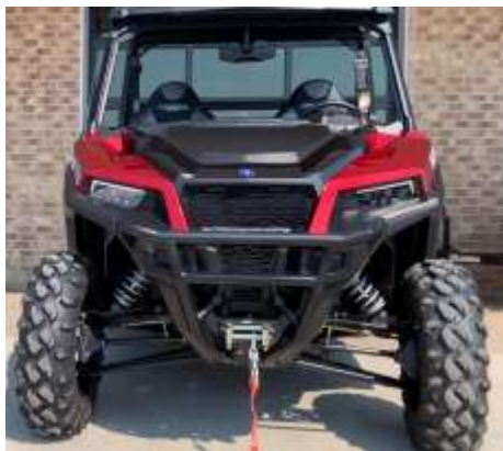
General XP 1000 EPS PREMIUM