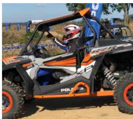
RZR XP TURBO EPS