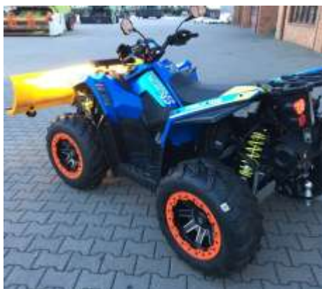
SCRAMBLER XP 1000 limited blue