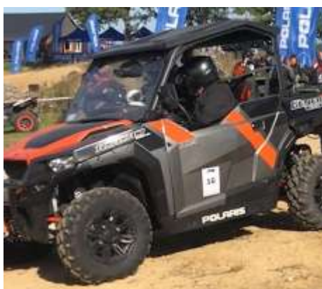
General XP 1000 Deluxe EPS ABS