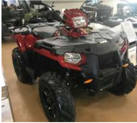
Sportsman 570 SP