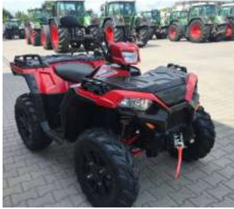
Sportsman XP 1000