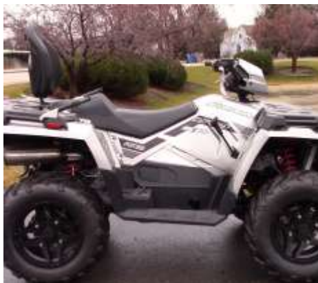
Sportsman 570 Touring SP