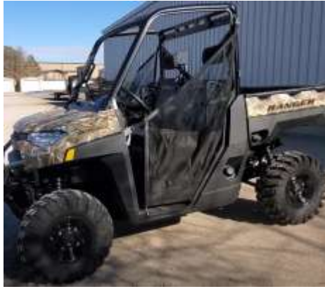
RANGER XP 1000 EPS CAMO