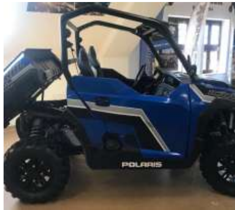
General 1000 Turbo