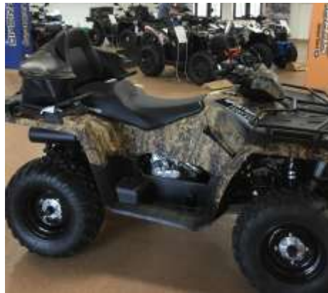
Sportsman Touring 570 EPS