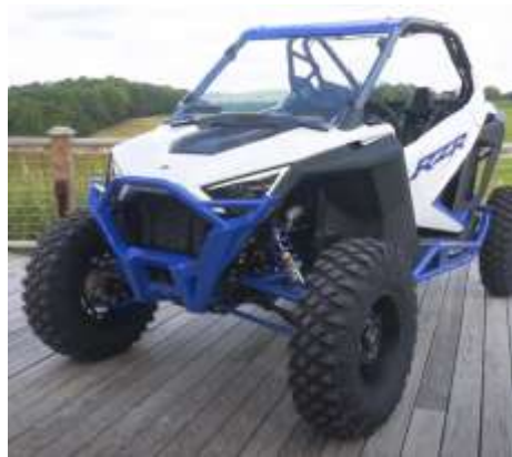
RZR PRO XP TURBO DYNAMIX