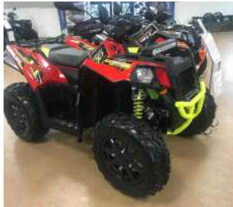
SCRAMBLER XP 1000