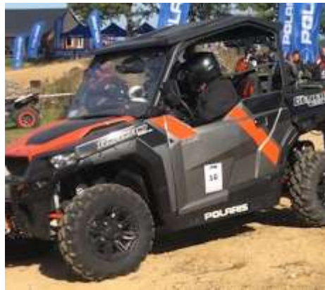
General XP 1000 Deluxe EPS ABS