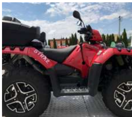
Sportsman XP 1000 STRAŽ