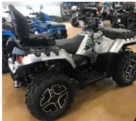
Sportsman Touring XP 1000