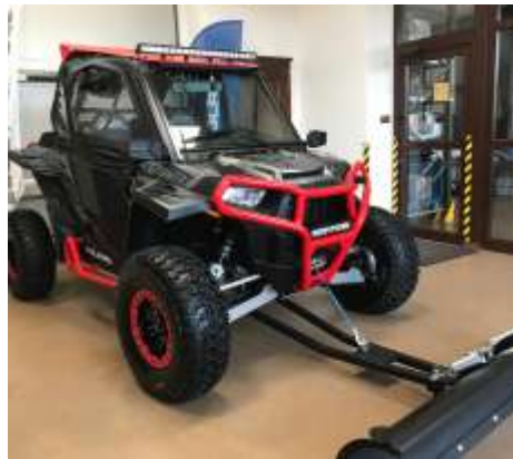
RZR XP TURBO SPORT