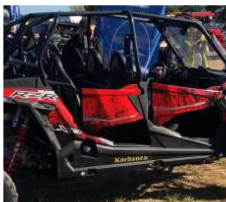
RZR XP 4 1000