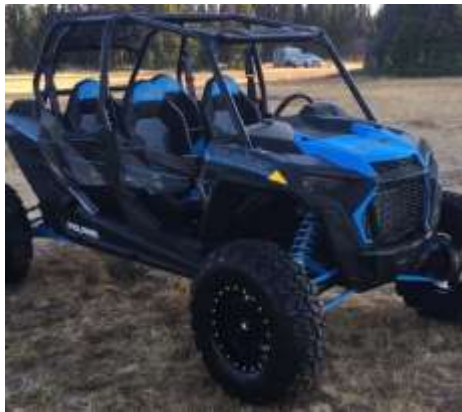
RZR XP 4 1000 TURBO EPS