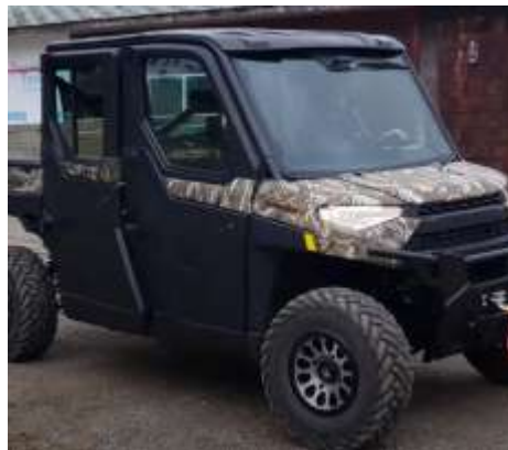
RANGER Crew 1000-6 EPS