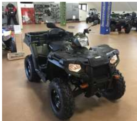
Sportsman 570 X2