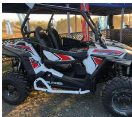
RZR XP 1000 EPS