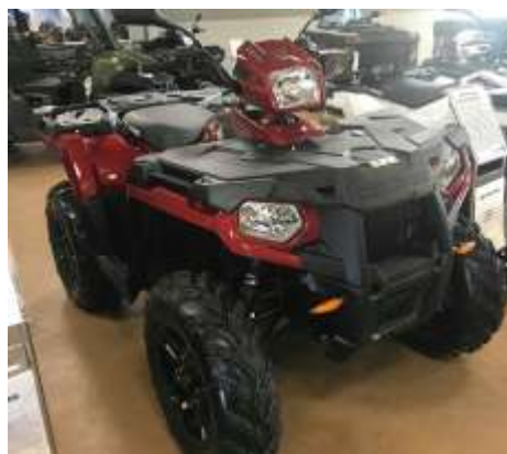
Sportsman 570 SP