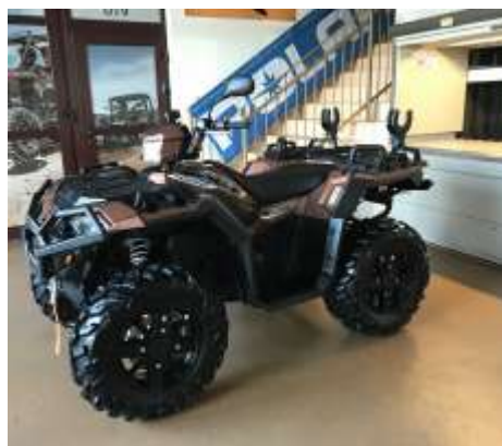
Sportsman XP 1000 LE FALCON