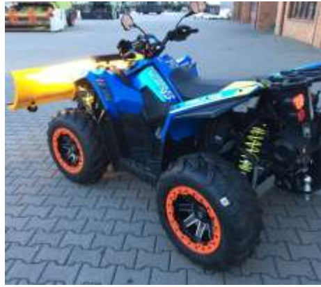
SCRAMBLER XP 1000 limited blue