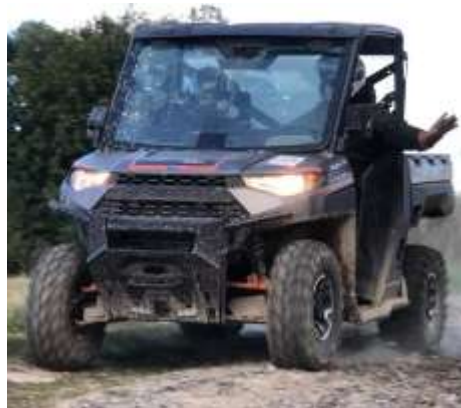
RANGER 1000 Xp EPS Sport