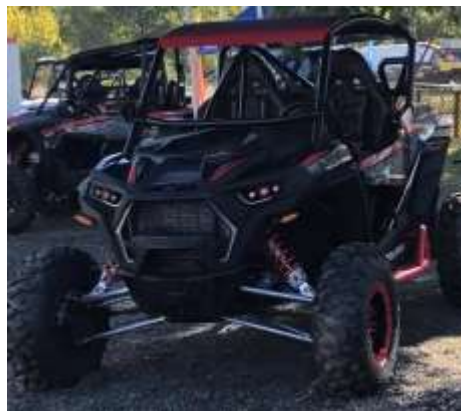
RZR S 1000 EPS