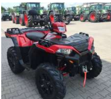
Sportsman XP 1000