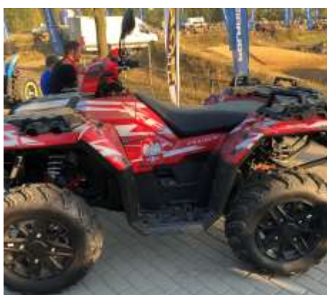
Sportsman XP 1000 HUSAR