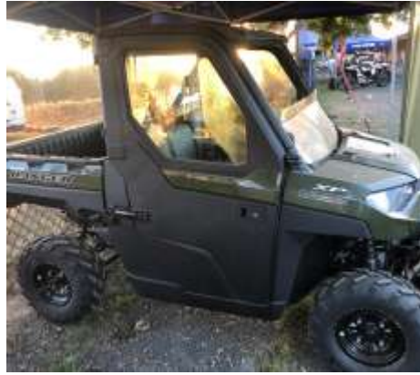
RANGER XP 1000 EPS