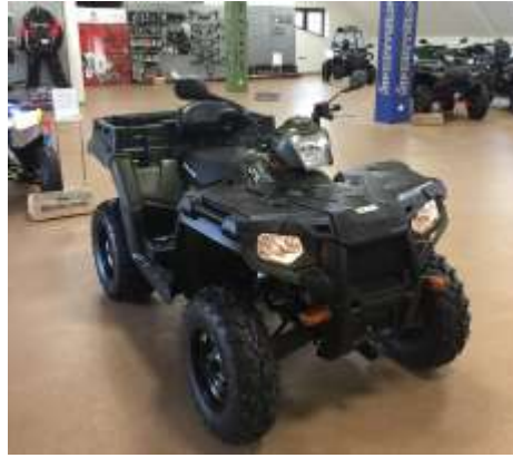
Sportsman 570 X2 UTE