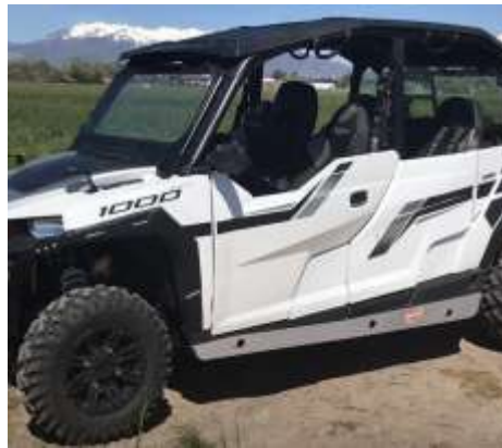
General 4 1000 EPS