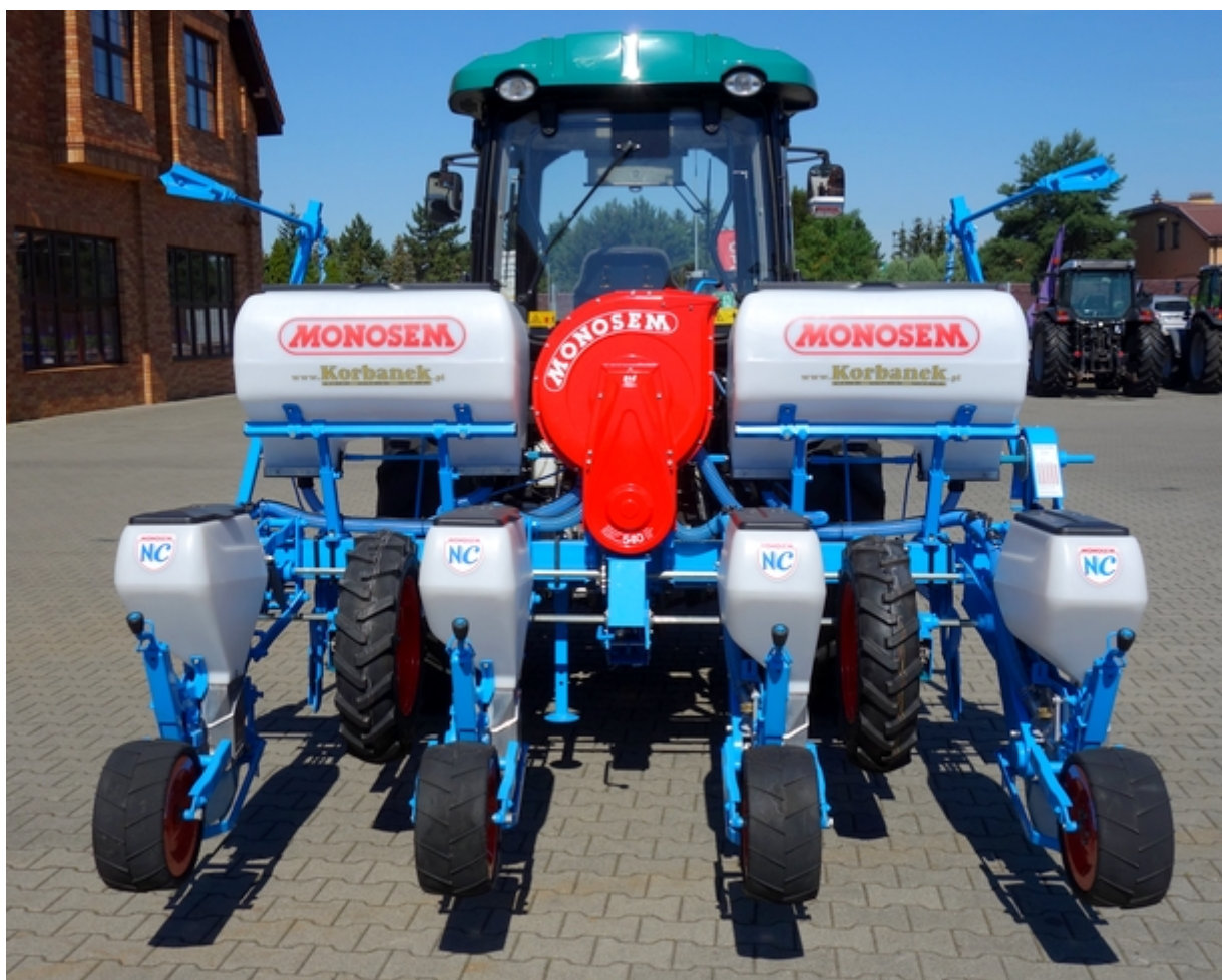
Siewnik punktowy z podsiewaczem nawozów

Siewnik umożliwia wysiew kukurydzy i jednocześnie podsiewanie nawozem granulowanym. Podsiewacz do nawozów ma pojemność 350 litrów (= 2 zbiorniki z tworzywa sztucznego, każdy po 175 litrów). W każdym zbiorniku znajduje się sito przeciwbrylające. Do podsiewania do gleby służą redlice stopkowe.