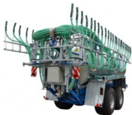
Dozownik Naglebowy Hydrauliczny