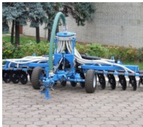
Aplikator doglebowy talerzowy 6