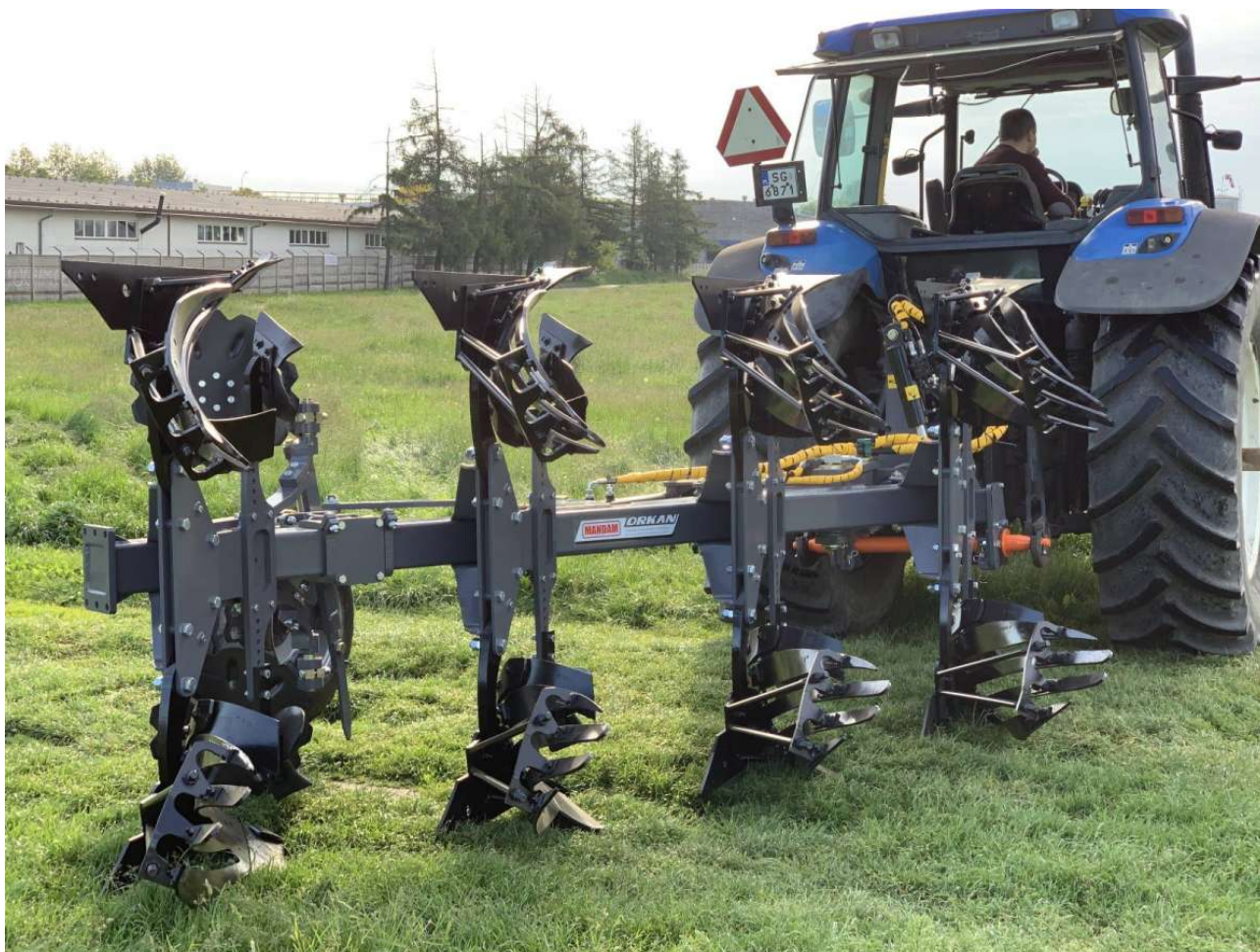
Plug obracalny orkan vario