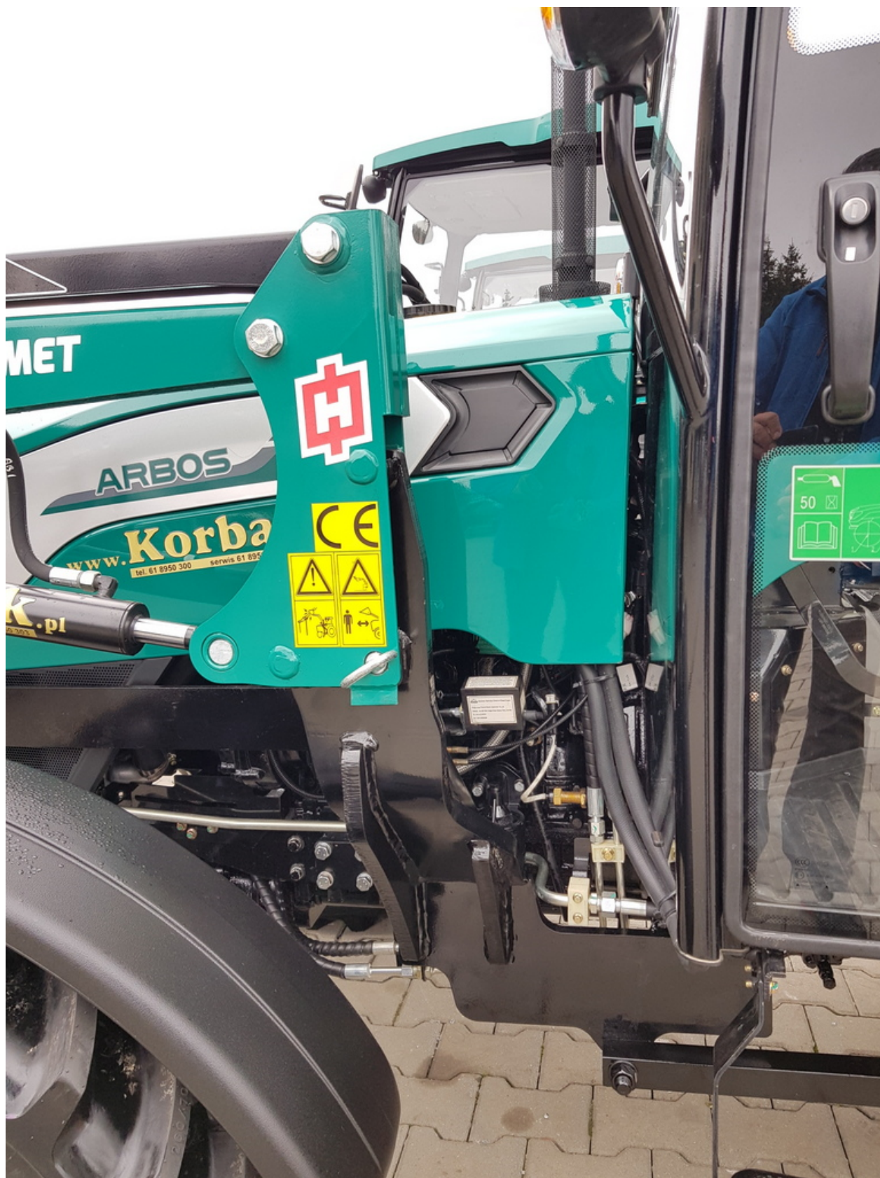
Konstrukcja wsporcza - mocowanie

Joystick zamocowany jest na wsporniku z możliwością regulacji pochylecia.