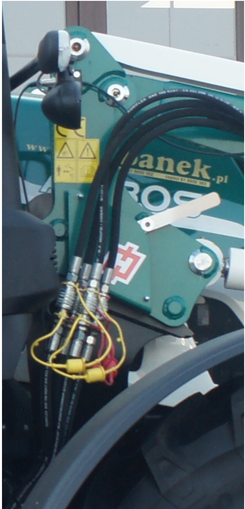
wyposażenie ładowacza xtreme