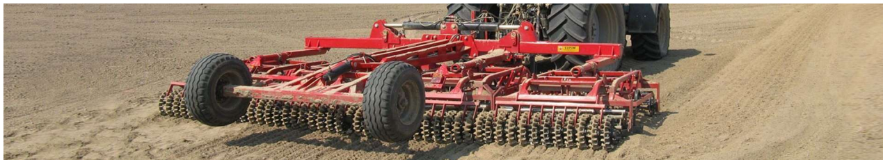
Wał łąkowy Expom MORS