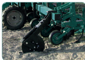
Kroje talerzowe prowadzące pielnik (OPCJA)

Oprócz najbardziej standardowych rozstawów między rzędami (do kukurydzy czy też do buraków) inne rozstawy również są dostępne na zamówienie.