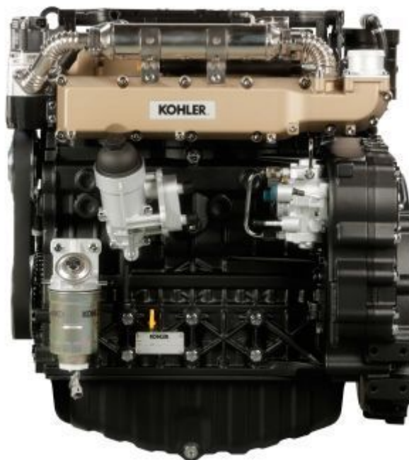
Silnik KOHLER 3404 TCR SCR - od 110 do 136 KM

Jedną z największych zalet tego silnika jest to, że wykorzystuje on jedynie technologię SCR (ze zintegrowanym katalizatorem DOC) umieszczoną w rurze wydechowej. Rezultatem wykorzystania tej technologii jest uzyskanie zwężanej i eleganckiej maski będącej cechą charakterystyczną marki oraz znakomitego promienia skrętu.