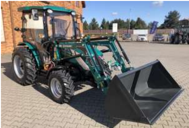
Ładowacz czołowy Ładowacz Czołowy Hydramet Xtreme S Mini (z możliwością dobrania osprzętu)