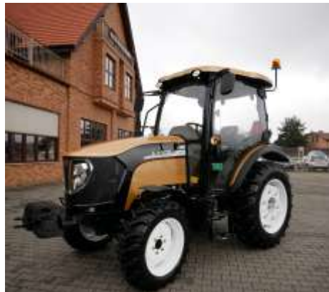
3055 Gold Limited+