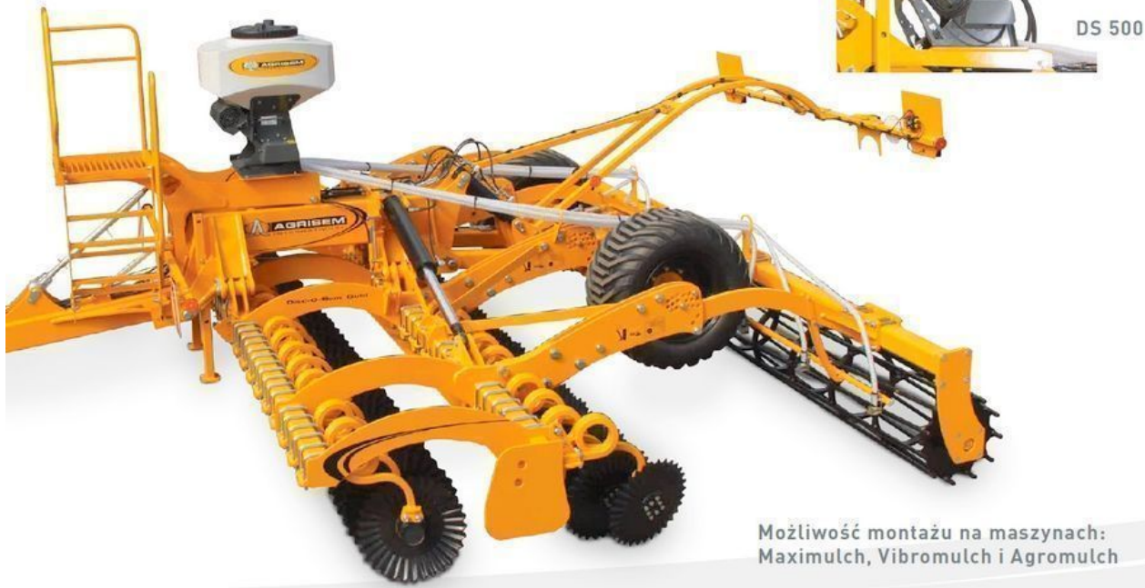
DS 200 z Disc-O-Mulch Gold 6m