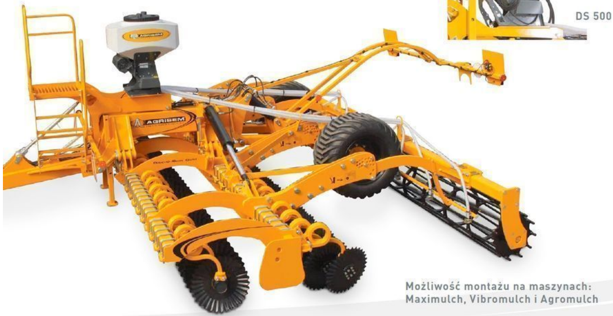
DS 200 z Disc-O-Mulch Gold 6m